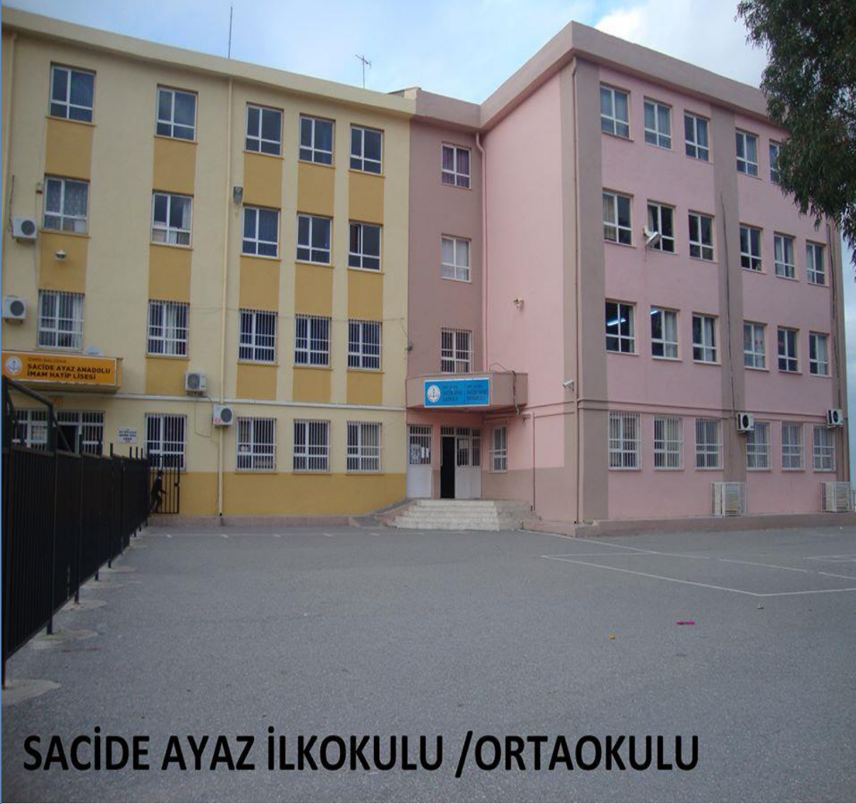
SACİDE AYAZ İLKOKULU / ORTAOKULU